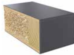
Plastkantlist NCS S 7502-B Laminat F2297 MAT