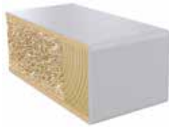
Plastkantlist NCS S 2500-N Laminat F7927 MAT