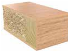
Plastkantlist ek 03 Laminat F7603 MAT