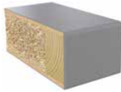
Plastkantlist NCS S 5000-N Laminat F7928 MAT