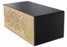
Plastkantlist NCS S 9000-N Laminat F2253 MAT