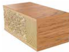
Plastkantlist ek 49 Laminat F6149 MAT