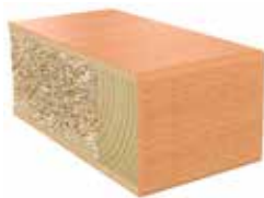
Plastkantlist bok Laminat F0190 MAT