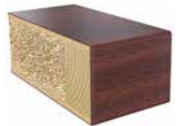
Plastkantlist mahogny Laminat F7008 MAT