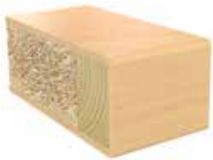
Plastkantlist bjørk Laminat F7921 MAT