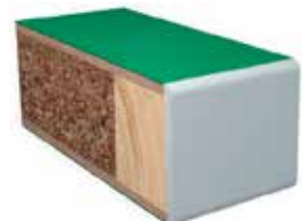
Brannklasse EI30, og/eller lydklasse R'w 25dB og R'w 30dB eller R'w 35dB.