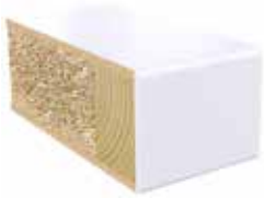
Plastkantlist NCS S 0502-G50Y Laminat F1040 MAT

Det finnes mange muligheter for å designe din egen laminatdør fra Swedoor JW. Vi kan nå tilby et sortiment av laminatdører med plastkantlist der kantlisten har samme farge som dørbladets overflate. Du kan velge mellom dører i gråskalaen, alt fra hvite dører til svarte dører, men du kan også velge dører i hele fargeskalaen. Her ser du de ulike valgmulighetene.