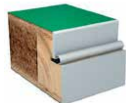
Brannklasse EI30 eller EI60 og/eller lydklasse R'w 35dB.